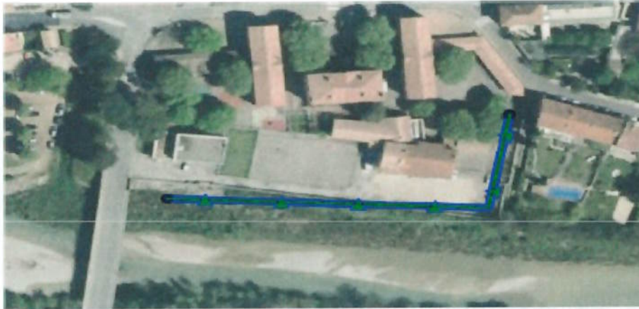
Extrait base de données SIOUH