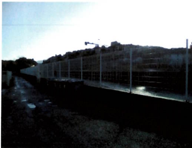
Mur-digue (réf 84F001) – Vue côté groupe scolaire Jules Ferry