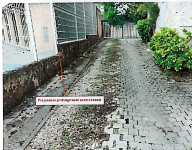
Mur-digue (réf 84F001) – Vue du retour en parpaing du mur-digue