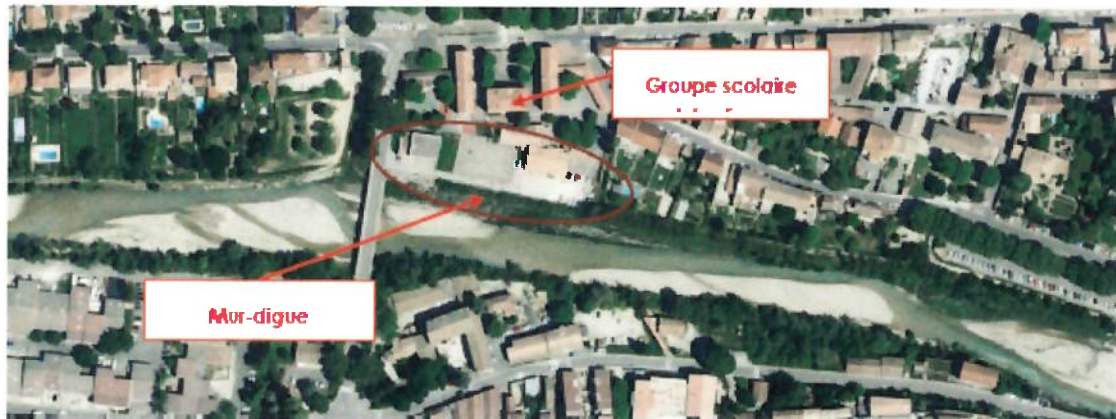
Localisation des secteurs de propriété communale

Cette digue fait l'objet d'un Arrêté Préfectoral n° SI 2007-10-23-0120- DDAF portant prescriptions complémentaires (au titre de la sécurité publique) sur le mur digne du groupe scolaire public Jules Ferry sur la commune de Vaison la Romaine.