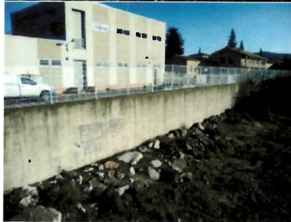
Mur-digue (réf 84F001) – Vue côté Ouvèze