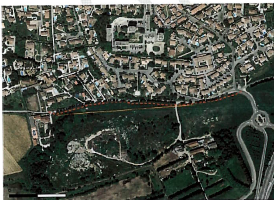
Digue de Chaffunes (trait jaune) et piste cyclable (trait pointillé rouge)