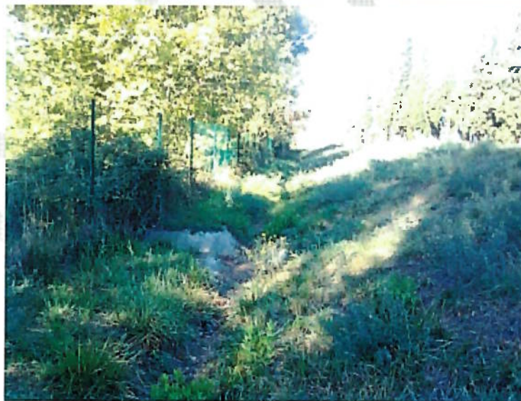
Digue de Chaffunes Ouvrage traversant diamètre 500 mm avec clapet